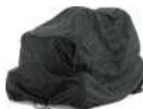
505 63 08-80 Kapell till traktor

Snökedjor till bakhjul på traktorer med däckdimension 18x8,5". Ger bra grepp vid körning på snö och is.