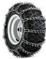
964 99 43-01 Snökedjor

16 kg. För ett bättre grepp och säkrare körning.