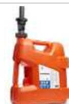
580 75 45-01 Bensindunk 15 Liter