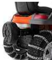
505 54 92-01 Motvikt

uppsamlartraktorer med nya chassin (passar inte 126-serien.)