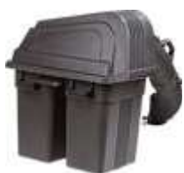
960 71 00-01 Uppsamlare

Uppsamlare med stor volym (210 liter) med 2-behållare. Passar 97 cm klippaggregat, uppsamlarknivar ingår.